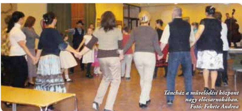
Táncbázis a művelődési központ nagy előcsarnokában.

Április 28-ig tekinthető meg a művelődési központ galériájában Tóth Imre hegedűkészítő és Tímári Balázs gobelin-készítő kiállítása.