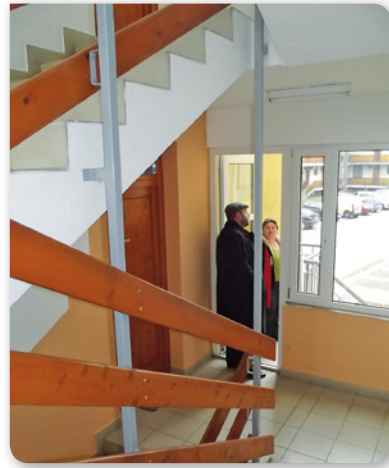
A felújított lépcsőház

A 12 évvel ezelőtt épített bérlakásra ráfért már a belső felújítás, hiszen az évek során több helyen megrongálódott a fal állaga, repedezések és különböző fol-