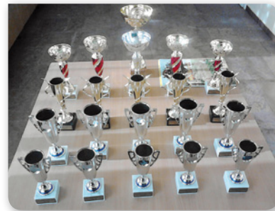
Fajta- és kiállításgyőztesekre várnak a serlegek

lenőrzik, értékelik az állatokat a MGKSZ. testület előírt sztenderdjé alapján. 100 pontról indul az értékelés, s ha valami hiba van – küllem, szín tollazat, fejforma, csőrforma, lábállás, farkállás stb. – következnek a levonások, s így adódik össze az értékelés. 97 pontig kitűnő, ez alatt már kiváló és így tovább. A 210 db kiállított állatból jelenleg 42 db kiváló lett – ök oklevélben részesülnek – a fajtagyőztes és kiállításgyőztes tenyésztők pedig serleget is kapnak. Itt jelenleg vásárolni nem lehet, de minden hónap első vasárnapján, a