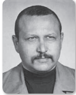
Hajdúnánás, 1935. július 6. – Budapest, 2015. augusztus 2.

Mottó: Itt állok ötven évesen gyerekem kinőtt cipőjében, síríg becsapva. Azt lesem, mint foszlik szét rejtelmesen kamasz-álmom: a Marxi Éden. (1985)