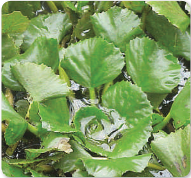
A sulyom holtágak növénye. Amikor beérik, a víz alá süllyed vagy a víz messzire elviszi. Védett növény.

ében. A tiszadobi grófi birtok majorsági központja közigazgatásilag Tiszaszederkény (ma Tiszaújváros) községhez tartozott. A századfordulóra az állandóan Pusztagyulaházán lakó cselédség száma egyre nőtt. Az új község alapjait a tömegesen Pusztagyulaházára költöző polgáriak vetették meg. „1903-ban például 54 polgári család költözött Gyulaháza tanyára”. De költöztek ide a közeli, sőt, még a távolabbi településekről is. A község alapítását a 27788/1908. IV. a. belügyminiszteri rendelet engedélyezte. Tiszagyulaháza elsősorban Tiszaszederkény közigazgatási területből, jórészt a grófi birtokból lett kiszakítva, de kiegészítettek a polgári határból is. A Trianon után területrendszerezéssel és közigazgatási határkiigazításokkal Szabolcs vármegyéhez került, majd 1950-ben a közigazgatási határmódosítások és megyekiigazítások