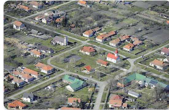
Légi felvétel a község központjáról

Maga a név a Tikos családnévből származik. Ez a régi családnév eléggé elterjedt az egész magyar nyelvterületen, 1452-ben egy oklevélben Tikos Péter (Petrus