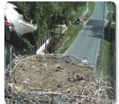
Az elhíresült webkamerával ellátott gólyafészek