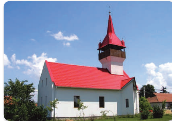
és a református templom

Thywkus) nevét említik. A családnévek kialakulása előtt személynévként is használták e szót, például 1219-ben: Thycus. A jelentése „tyúkös”. Újtikos nevében az új előtag a település fiatal voltára utal, egyben megkülönbözteti az előtag nélküli Somogy megyei Tikos falutól.