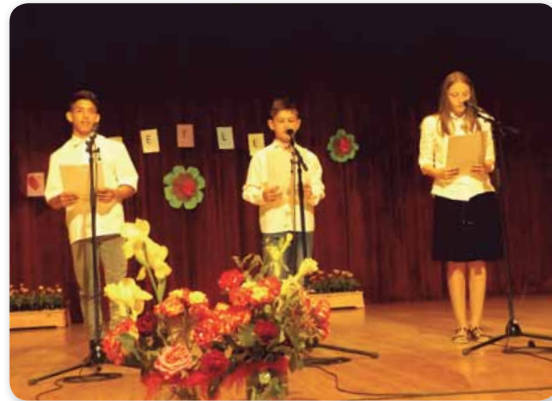
Nevelőnők napja Hajdúnánás

Eseményekben gazdagon búcsúztattuk a tavaszt 2016-ban a Hajdúsági Görögkatolikus Gyermekvédelmi Központ Nevelőszülői hálózatánál.