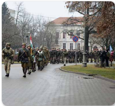
Első alkalommal fogadta Hajdúnánás a Doni Hősök Emléktúrá résztvevőit január végén