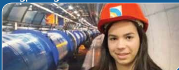
„Felfedezem a világ csodáit” – avagy látogatás a CERN-ben