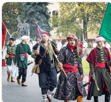
3. Hajdúk Világtalálkozója