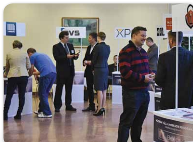
Modern Vállalkozások Napja: Vállalkozz digitálisan!