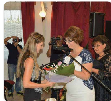
Húsz éves a Fehér Bot Alapítvány