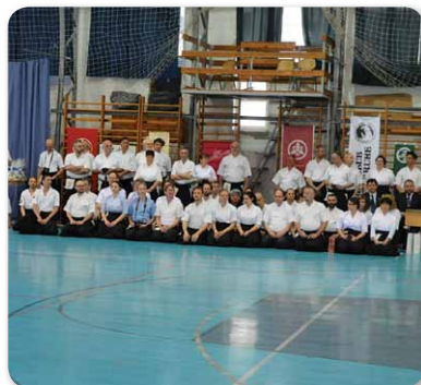
3. Nemzetközi Heki Taikai íjász verseny Hajdúnánáson