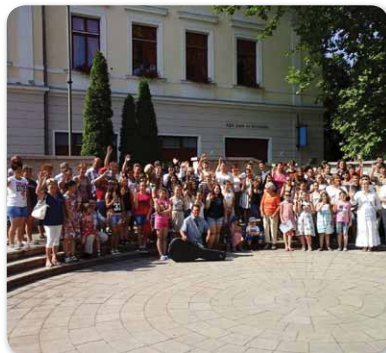
Ötödik Barátságnap a Bocskai Iskola szórvány programjának keretében