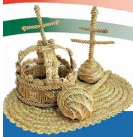
Városi kitüntető díjak 2016.