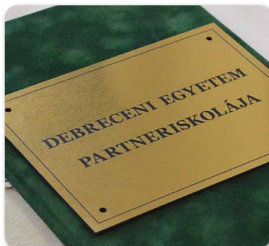
A Debreceni Egyetem partneriskolája lett a Kövösi Református Gimnázium