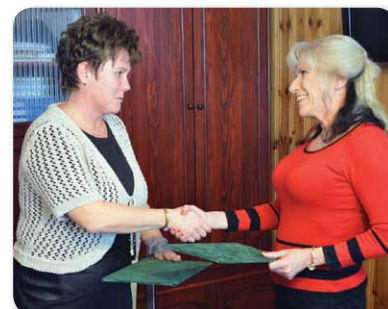
Együttműködési megállapodás a Debreceni Egyetem és a B. Sz. C. Csiha Győző Szakgimnáziuma és Szakközépiskolája között