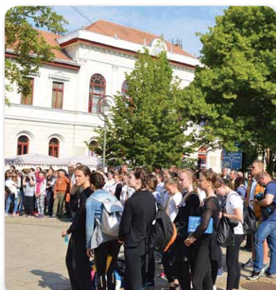
45. Hajdú-Bihar Megyei Elsősegélynyújtó Verseny