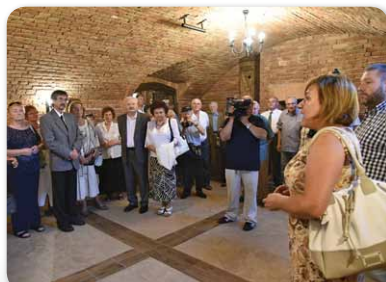
Hazaváró ünnep 2016.