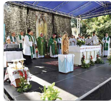
6. Székely Menekültek Emléknapja