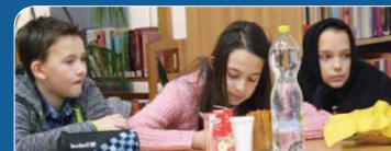
Kik is vagyunk?