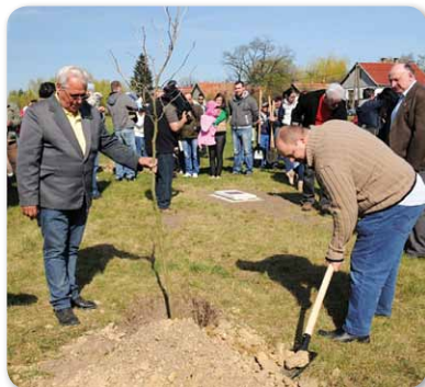
Gyökerek: faültetés az újszülöttek tiszteletére