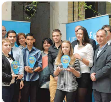
UNICEF Gyerekbarát Település címet kapott Hajdúnánás