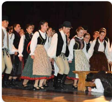
48. Hajdú-Bihar Megyei Gyermek- és Ifjúsági Néptáncfórum