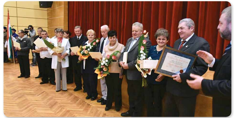
Hajdúnánási Polgárőr Egyesület Tedeji Csoportja