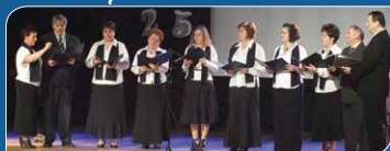
25 éves jubileumi ünnepség a Csiha Győző iskolában