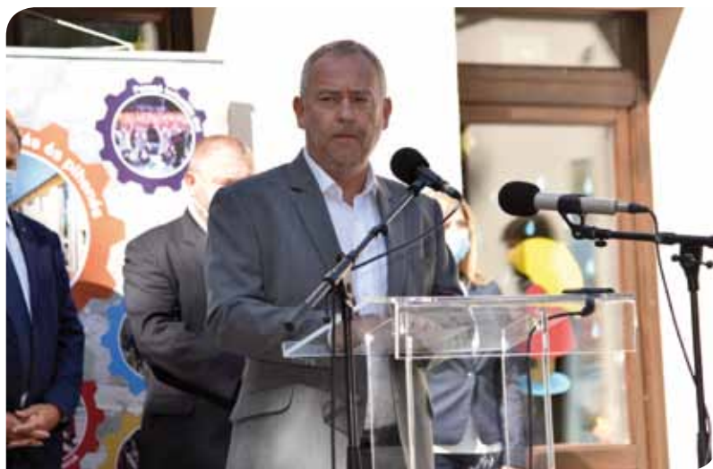
Rácz Róbert kormány megbízott