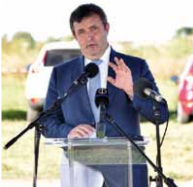
Palkovics László Innovációs és Technológiai Miniszter

Városunk az elmúlt időszakban igyekezett felkészülni a befektetők fogadására és ezáltal hozzájárulni a teljes hazai befektetési környezet versenyképességének fokozására.