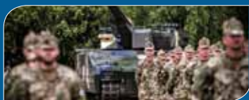
Irány a sereg!